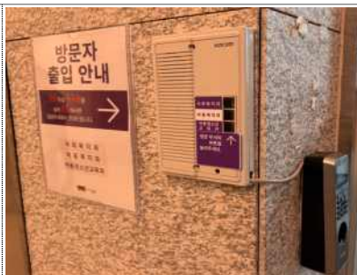
인터폰 시스템 (부서명 표기)