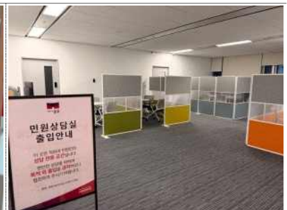
공동 민원상담실 조성