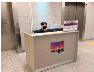
출입관리시스템 (방호직원 배치)