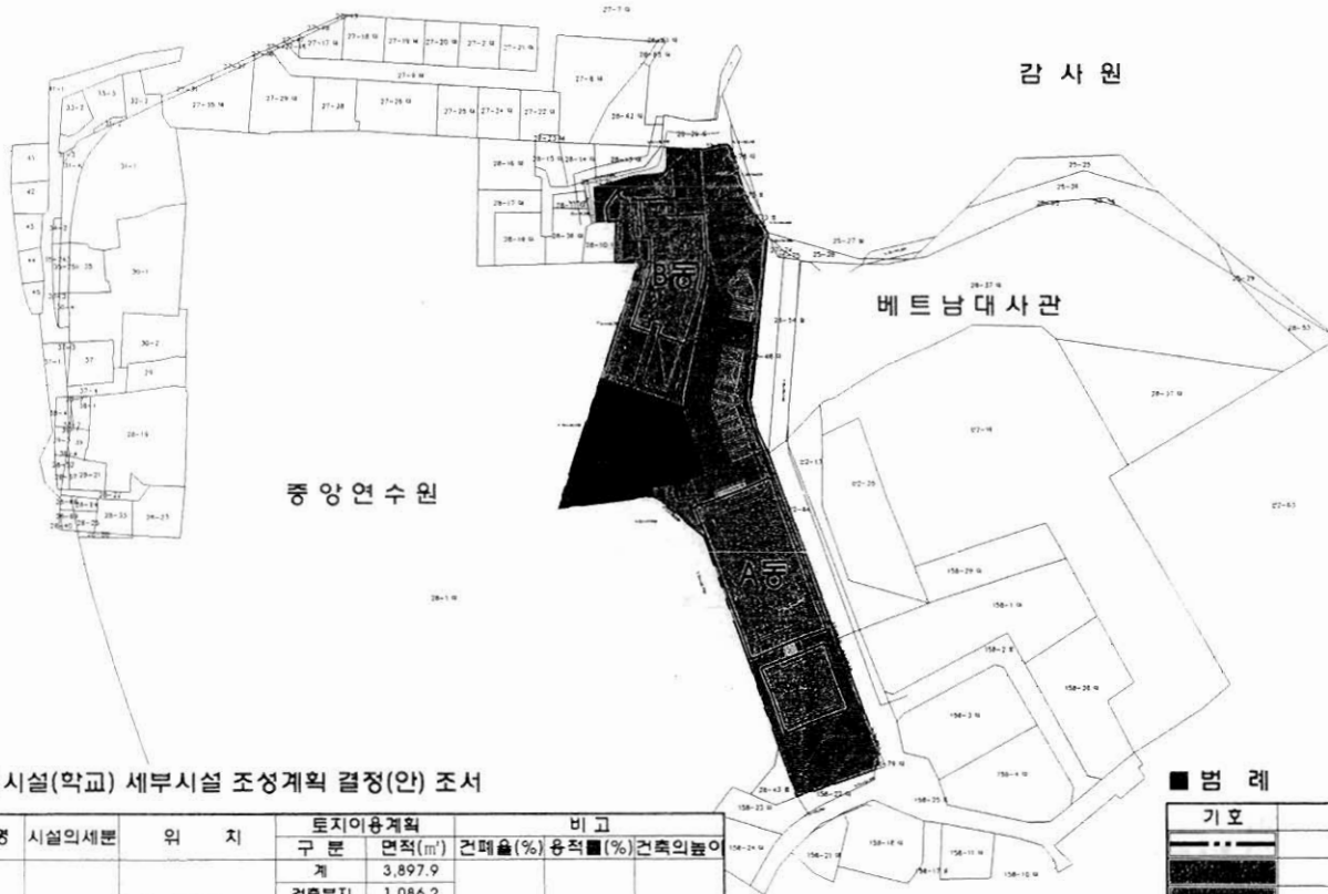
■ 도시계획시설(학교) 세부시설 조성계획 결정(안) 조서