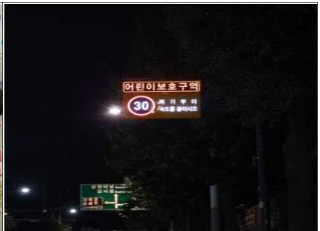
LED 표지 교체